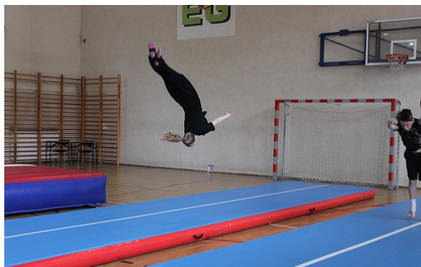
(dla AKROBATYKA ( dla przedszkolaków )