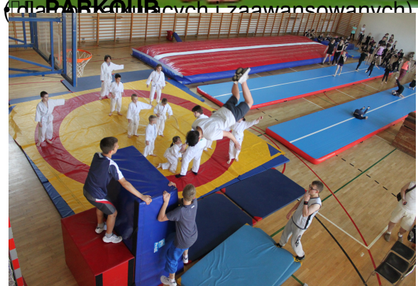
(Dla PARKOUB-owców i zaawansowanych)