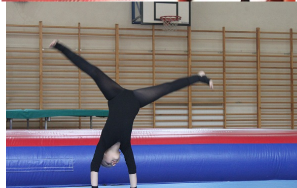
6. Akrobastyka (dla dzieci i młodzieży)