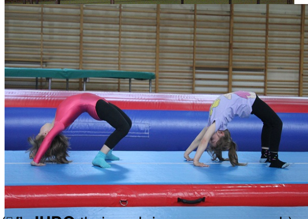
(dla JUDO (dla początkujących i zaawansowanych)